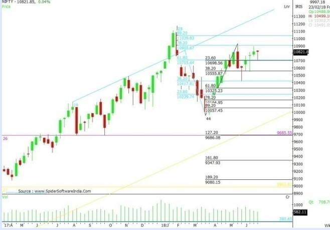
NIFTY WEEKLY CHART

ઉપરમાં ૨૨૪૨૭.૪૫ અને નીચામાં ૨૧૭૭૭.૬૫ નો ભાવ જોવા મળ્યો હતો.